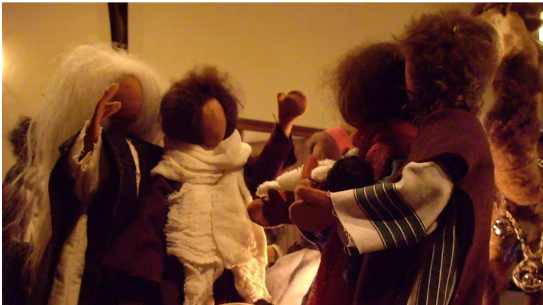
Babylesen: Die zwei Alten und das Jesuskind (Epiphaniaskirche, 3.1.2011)

Alle haben ganz aufmerksam zugehört. Dann wollen Maria und Joseph aufbrechen, damit sie noch im Hellen nach Bethlehem zurückkehren können. Zum Abschied sagt Hanna zu ihnen: „Euer Kind wird euch froh machen. Und viele andere auch. Gott*Ewige segne und behüte euch.“